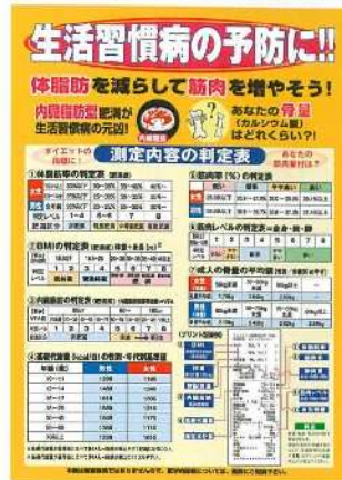
●測定結果の判定用ポスター (B3)