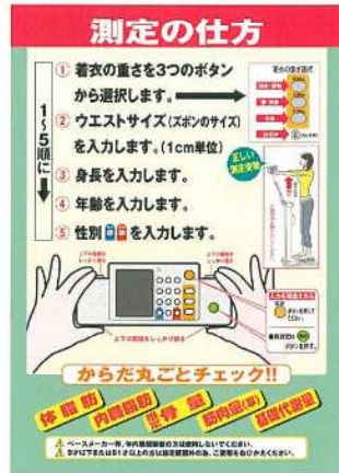
●操作説明ポスター (B3)